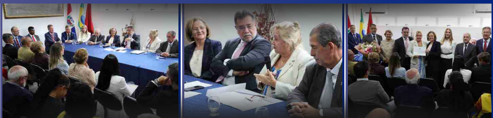
29 de Janeiro de 2026