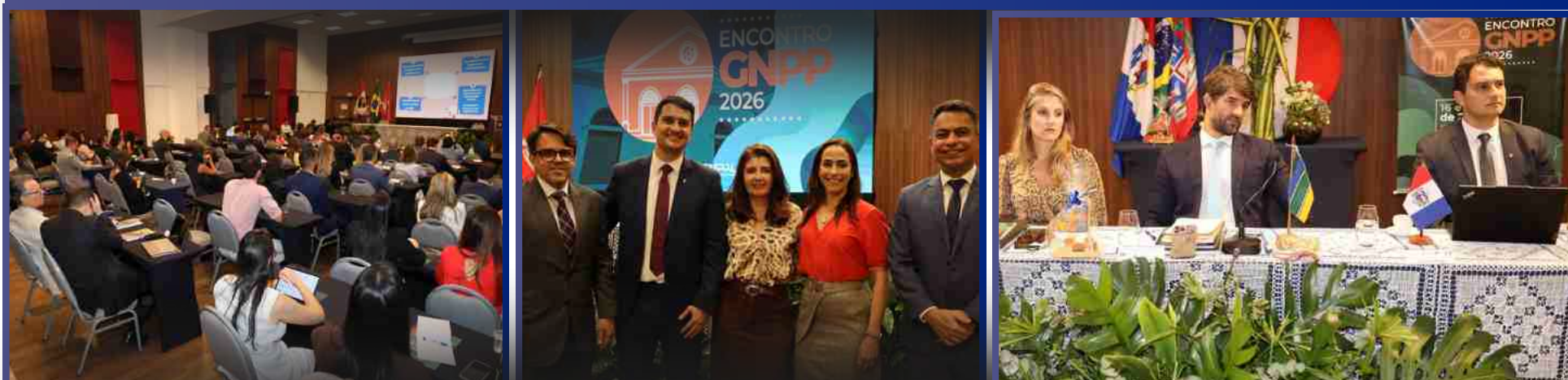
16 e 17 de Abril de 2026