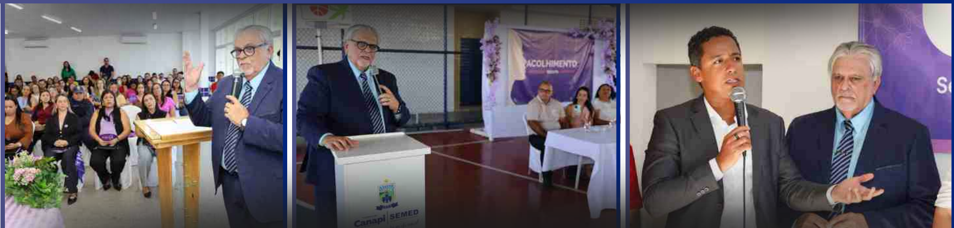
05 de março de 2026