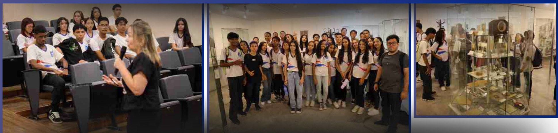
11 de Março de 2026