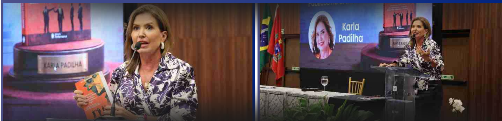
16 de Abril de 2026