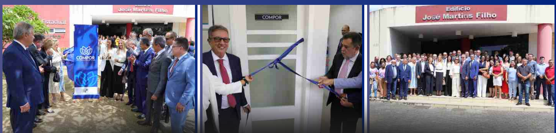
29 de Janeiro de 2026