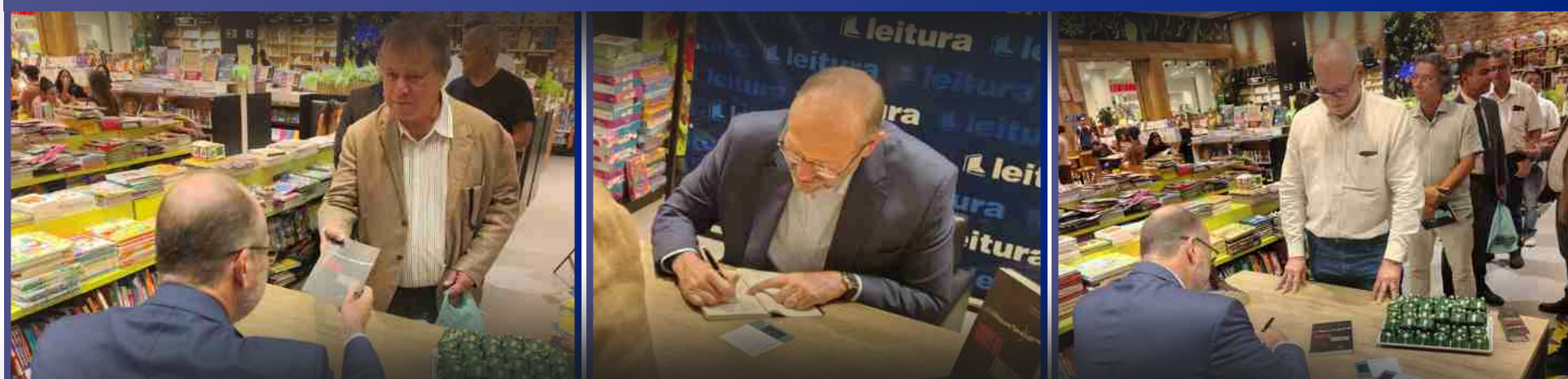
16 de Abril de 2026