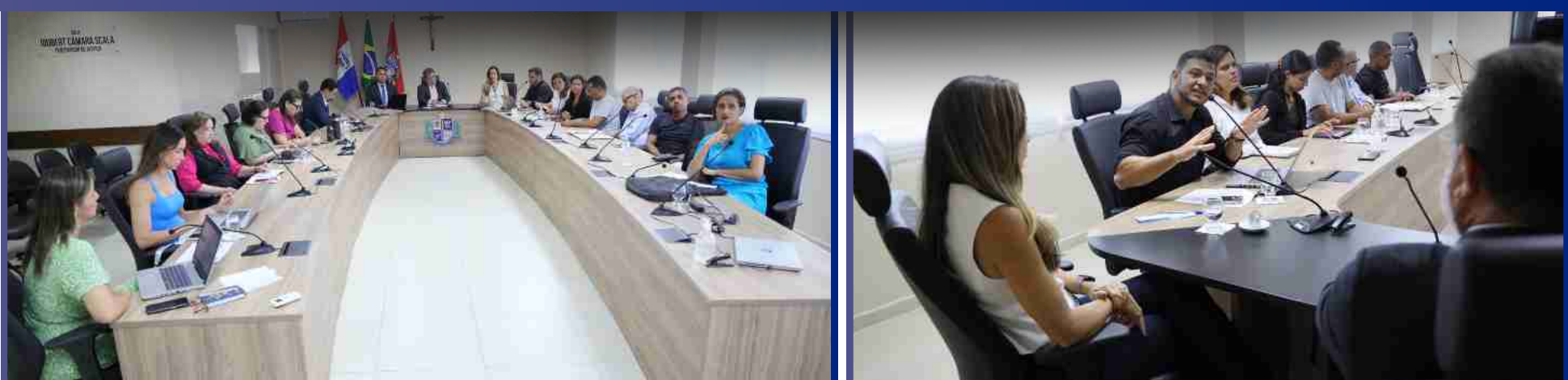
28 de Janeiro de 2026