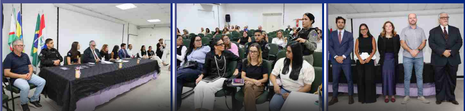
13 de Março de 2026