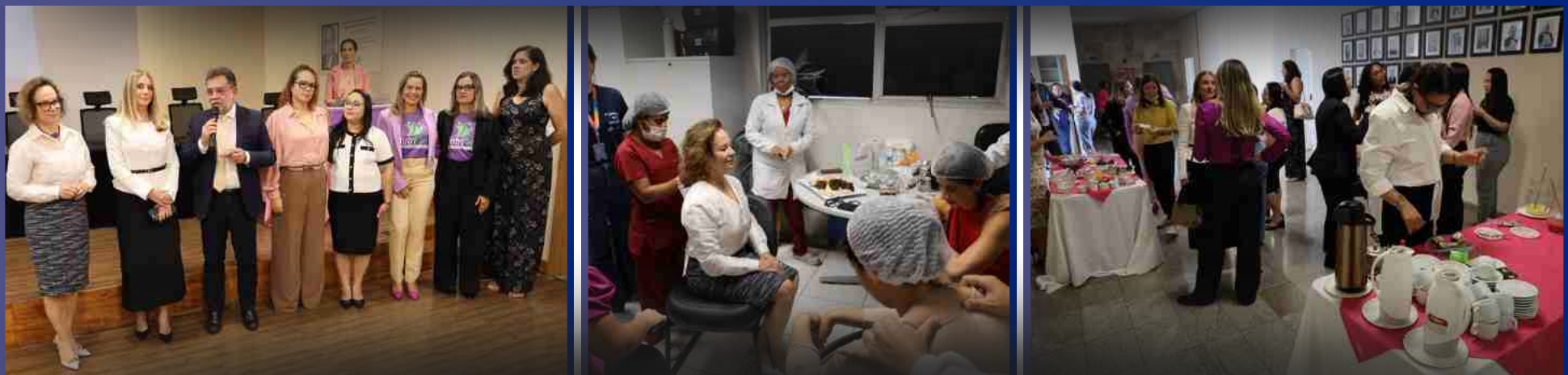
9 de Março de 2026