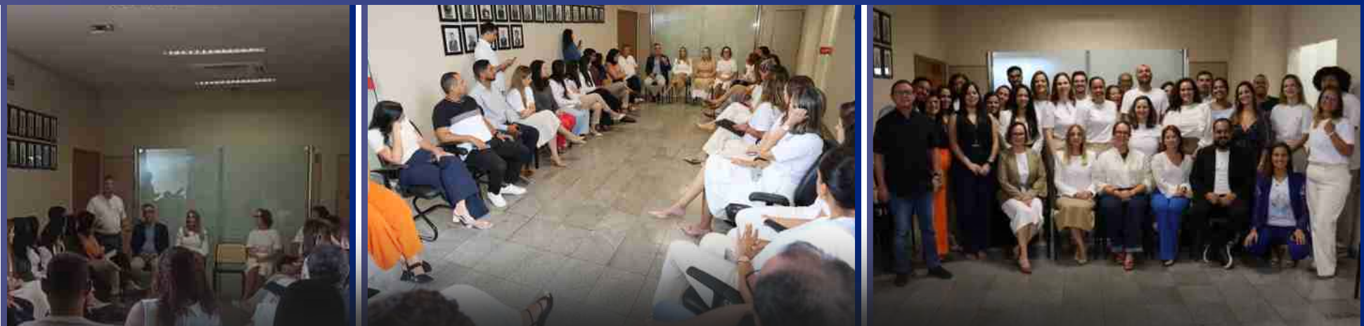
22 de Janeiro de 2026