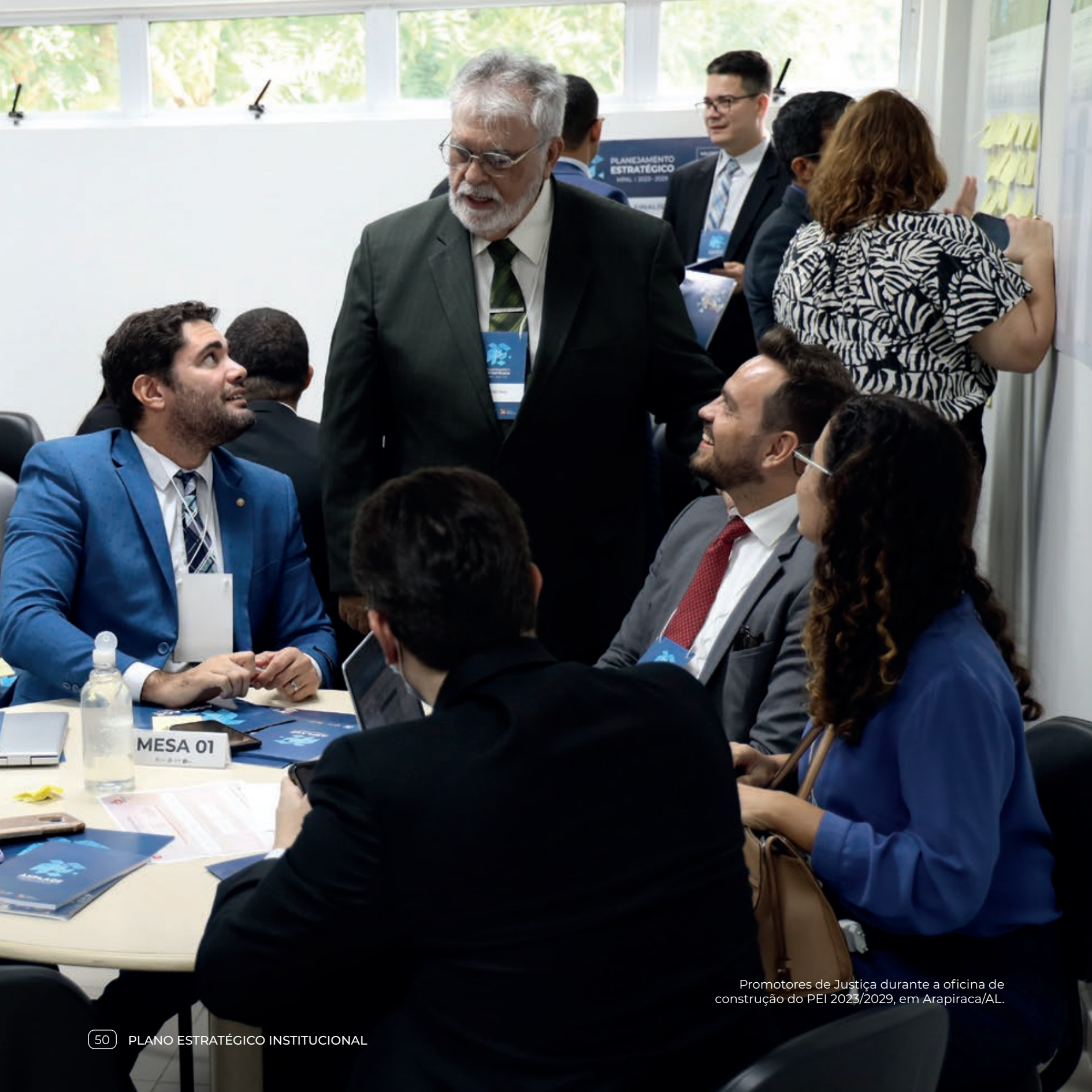
Promotores de Justiça durante a oficina de construção do PEI 2023/2029, em Arapiraca/AL.