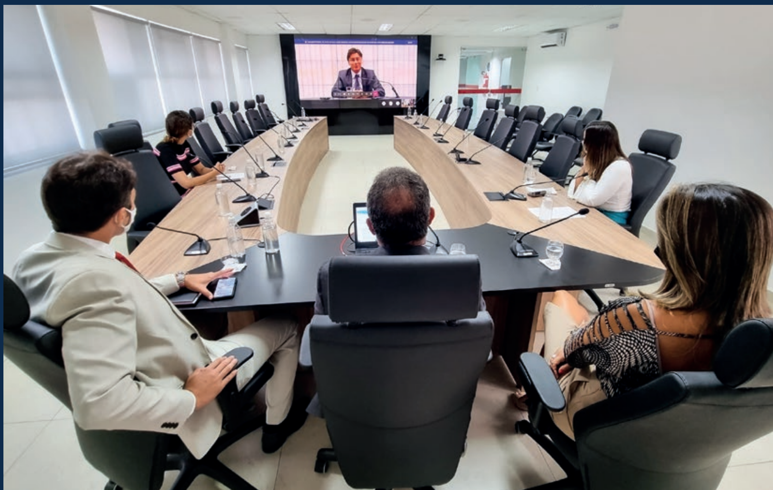
Assinatura, de forma virtual, do termo de adesão ao Mapa Estratégico Nacional do Ministério Público.