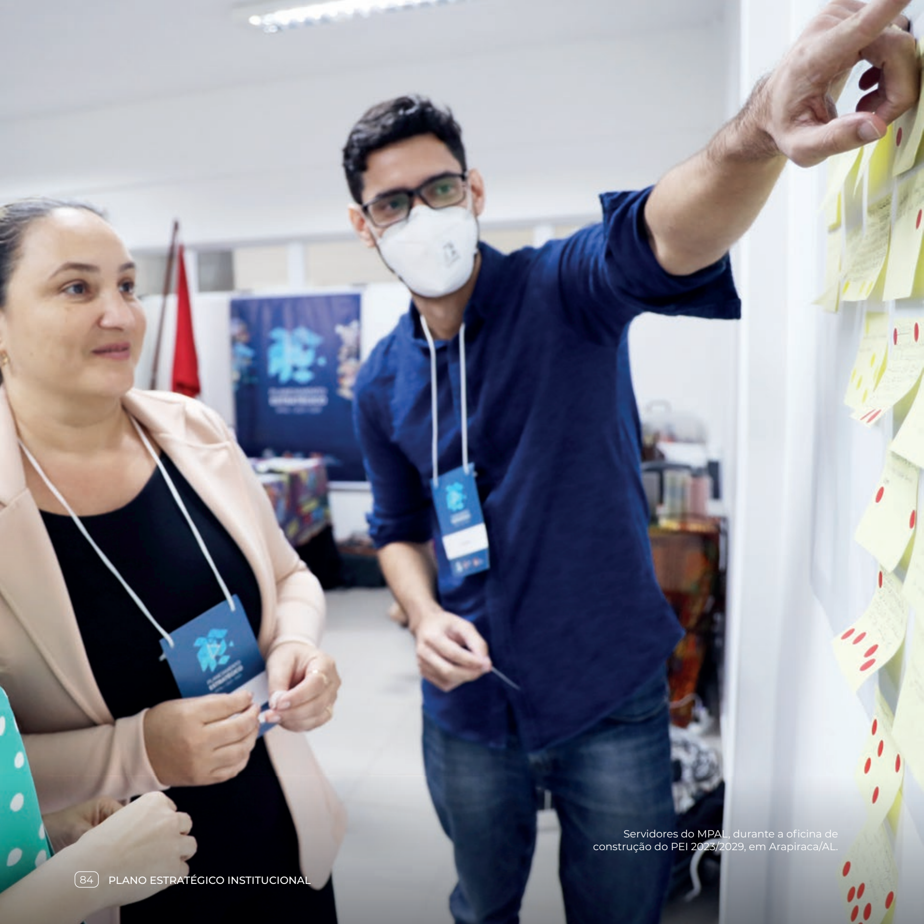
Servidores do MPAL, durante a oficina de construção do PEI 2023/2029, em Arapiraca/AL.