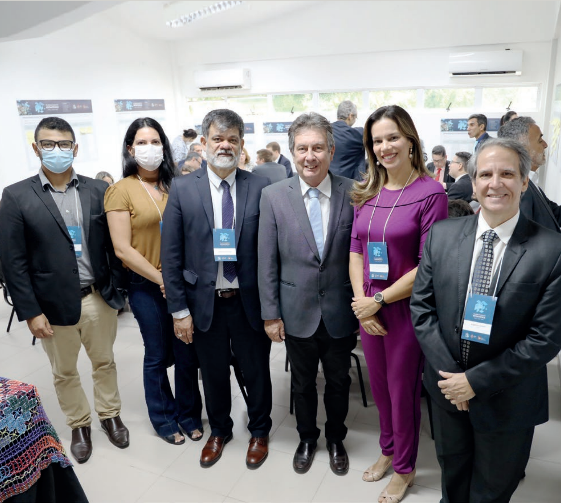
Subprocuradoria-geral Administrativa, Assessoria de Planejamento e Gestão Estratégica e Comissão de Planejamento Estratégico do CNMP.