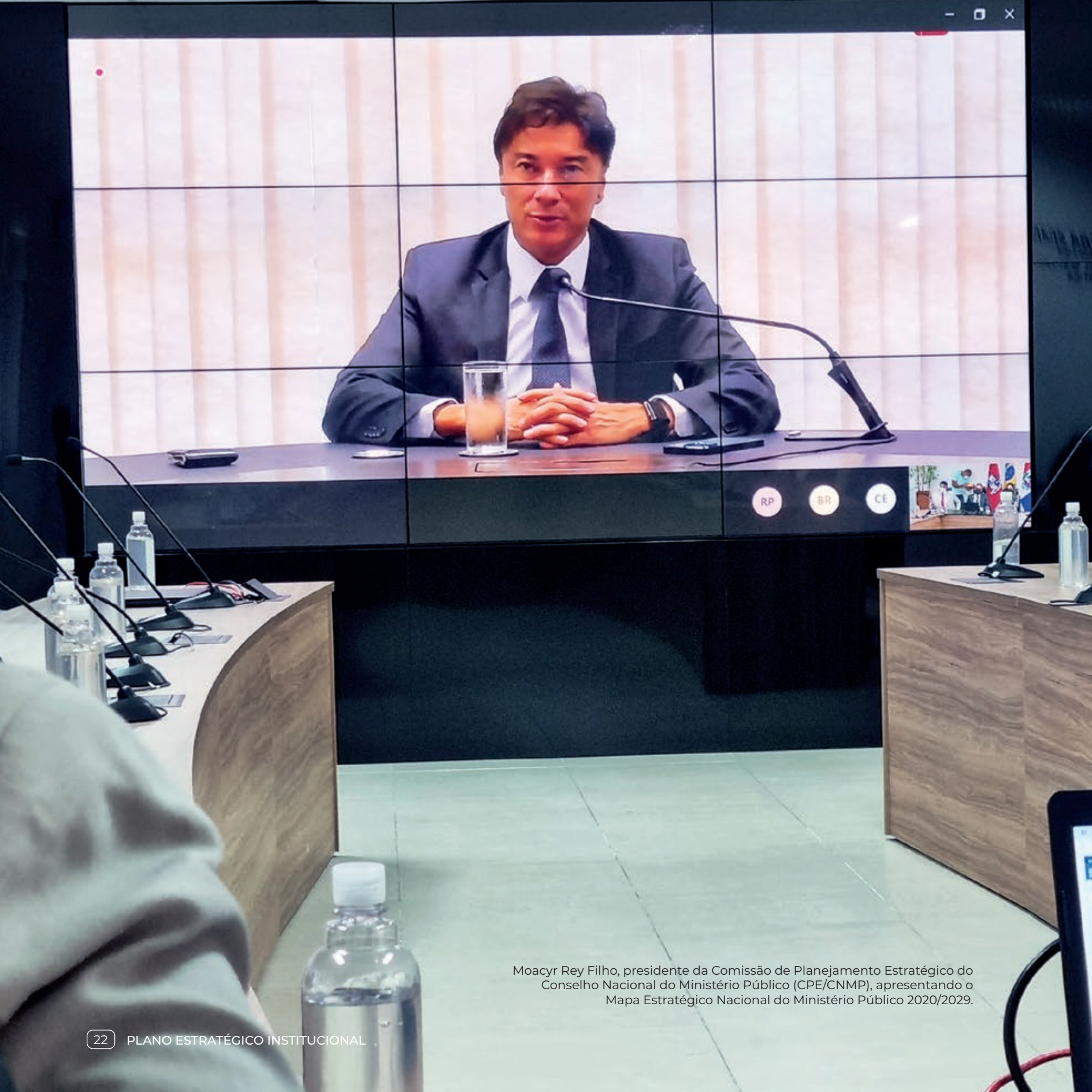
Moacyr Rey Filho, presidente da Comissão de Planejamento Estratégico do Conselho Nacional do Ministério Público (CPE/CNMP), apresentando o Mapa Estratégico Nacional do Ministério Público 2020/2029.