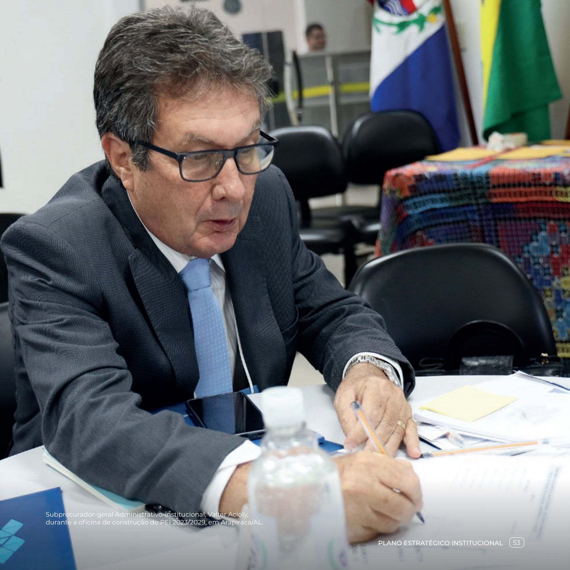
Subprocurador-geral Administrativo-institucional, Valter Acioly, durante a oficina de construção do PEI 2023/2029, em Arapiraca/AL.