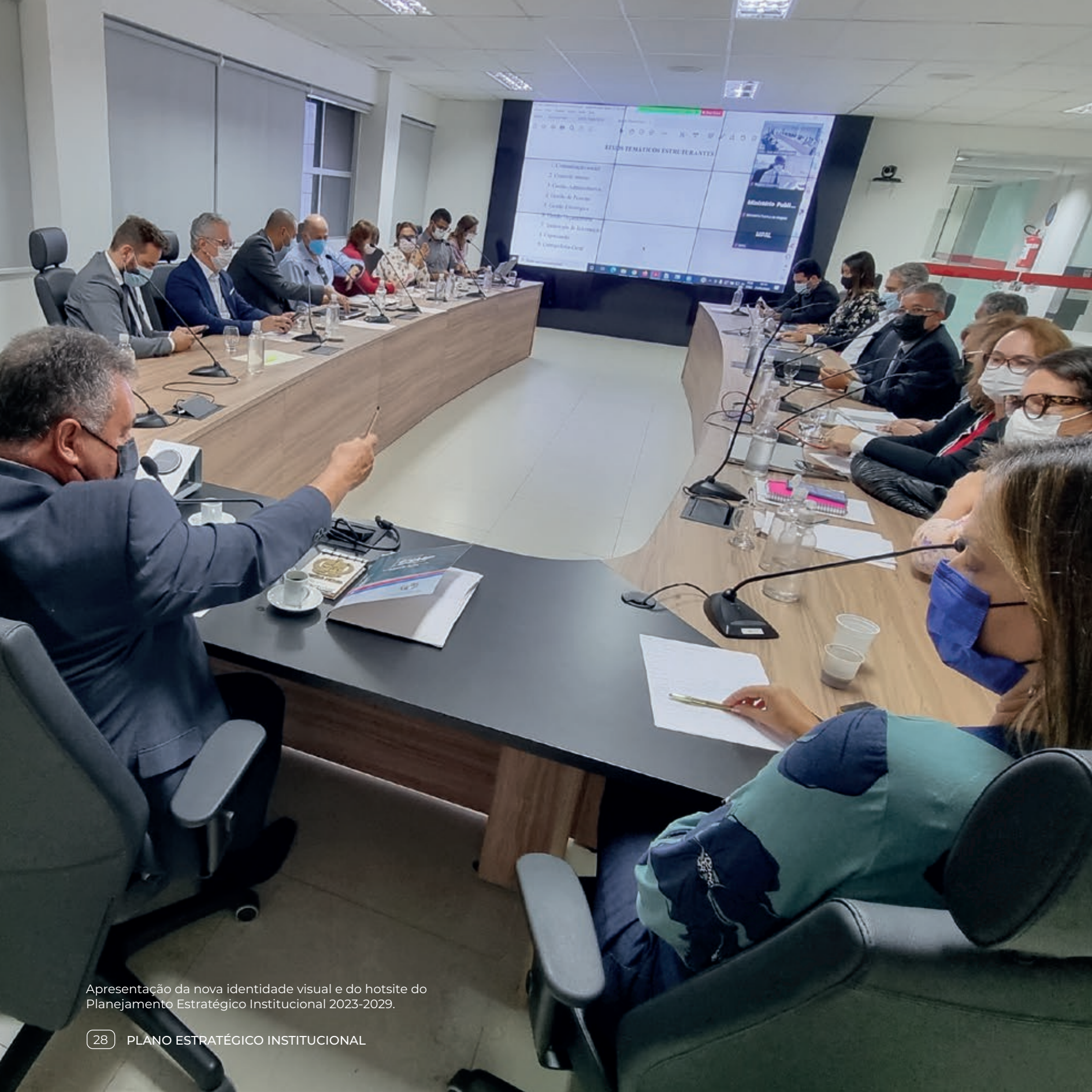
Apresentação da nova identidade visual e do hotsite do Planejamento Estratégico Institucional 2023-2029.