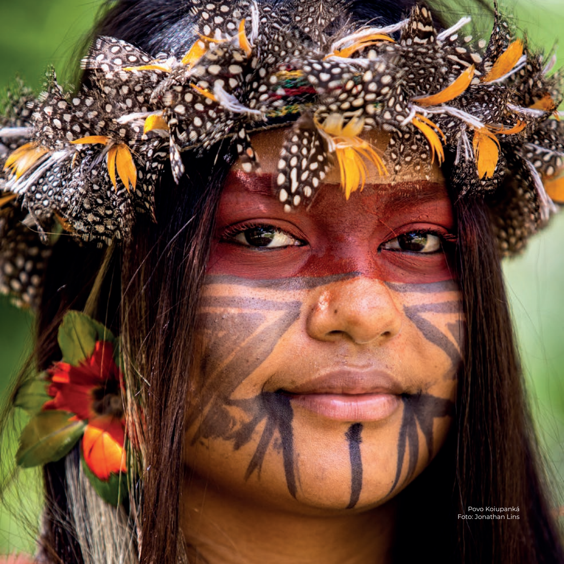
Povo Koiupanká