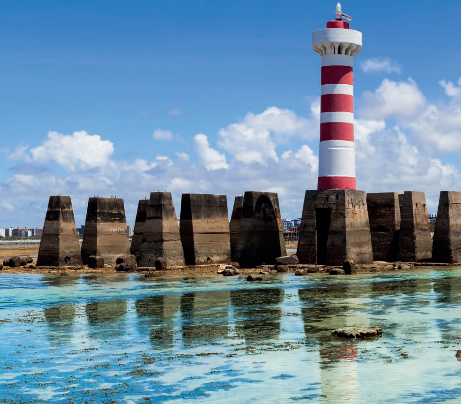
Farol da Ponta Verde