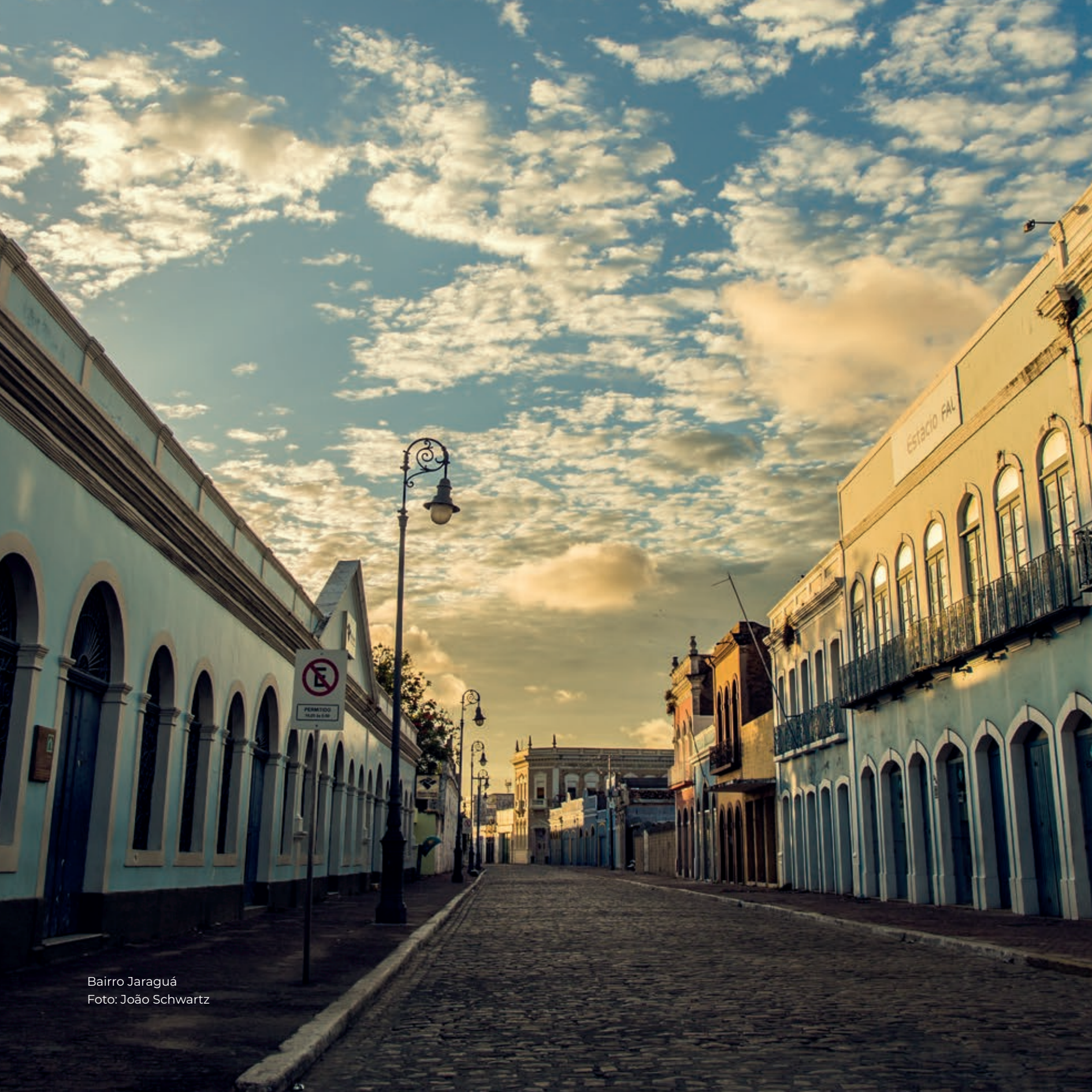
Bairro Jaraguá