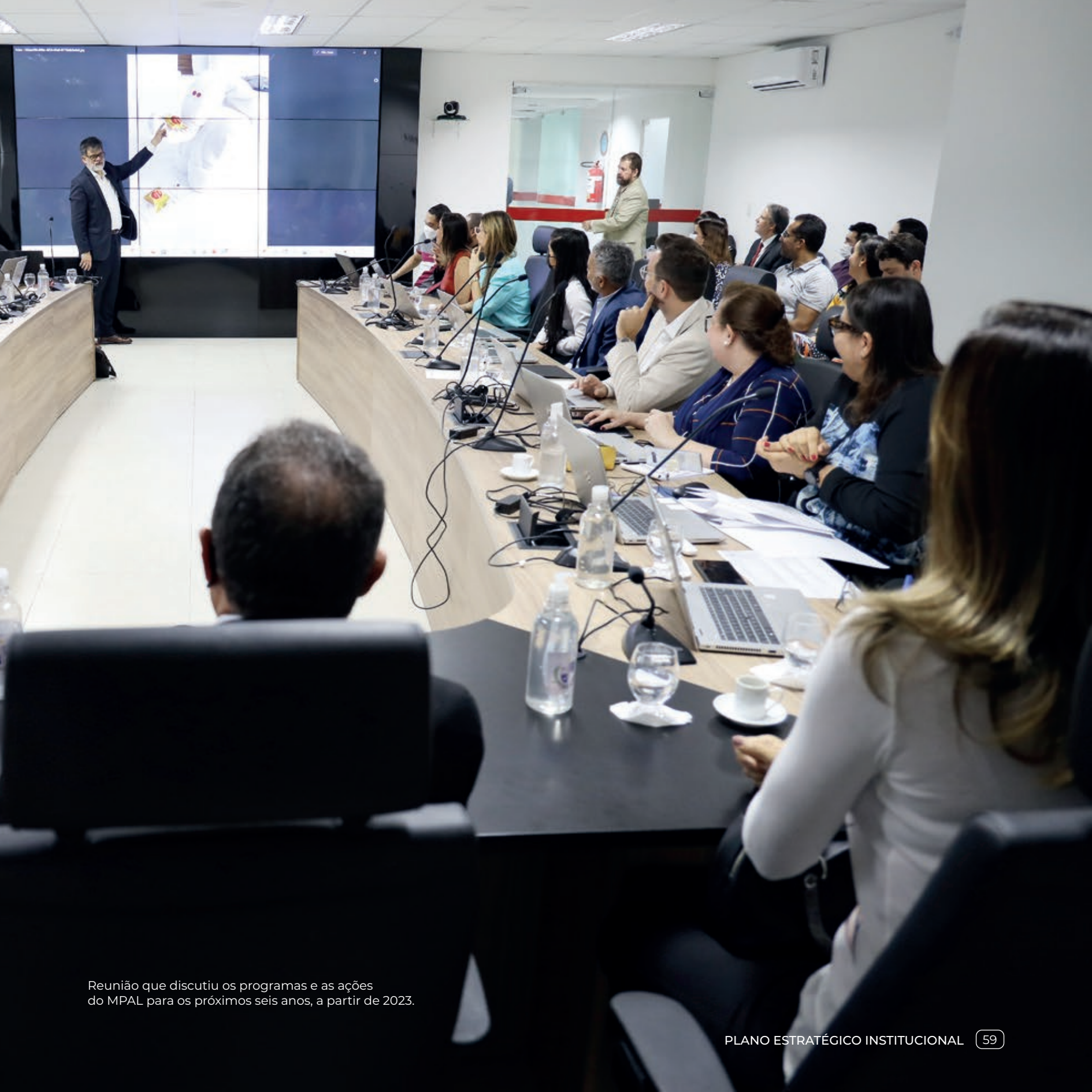
Reunião que discutiu os programas e as ações do MPAL para os próximos seis anos, a partir de 2023.