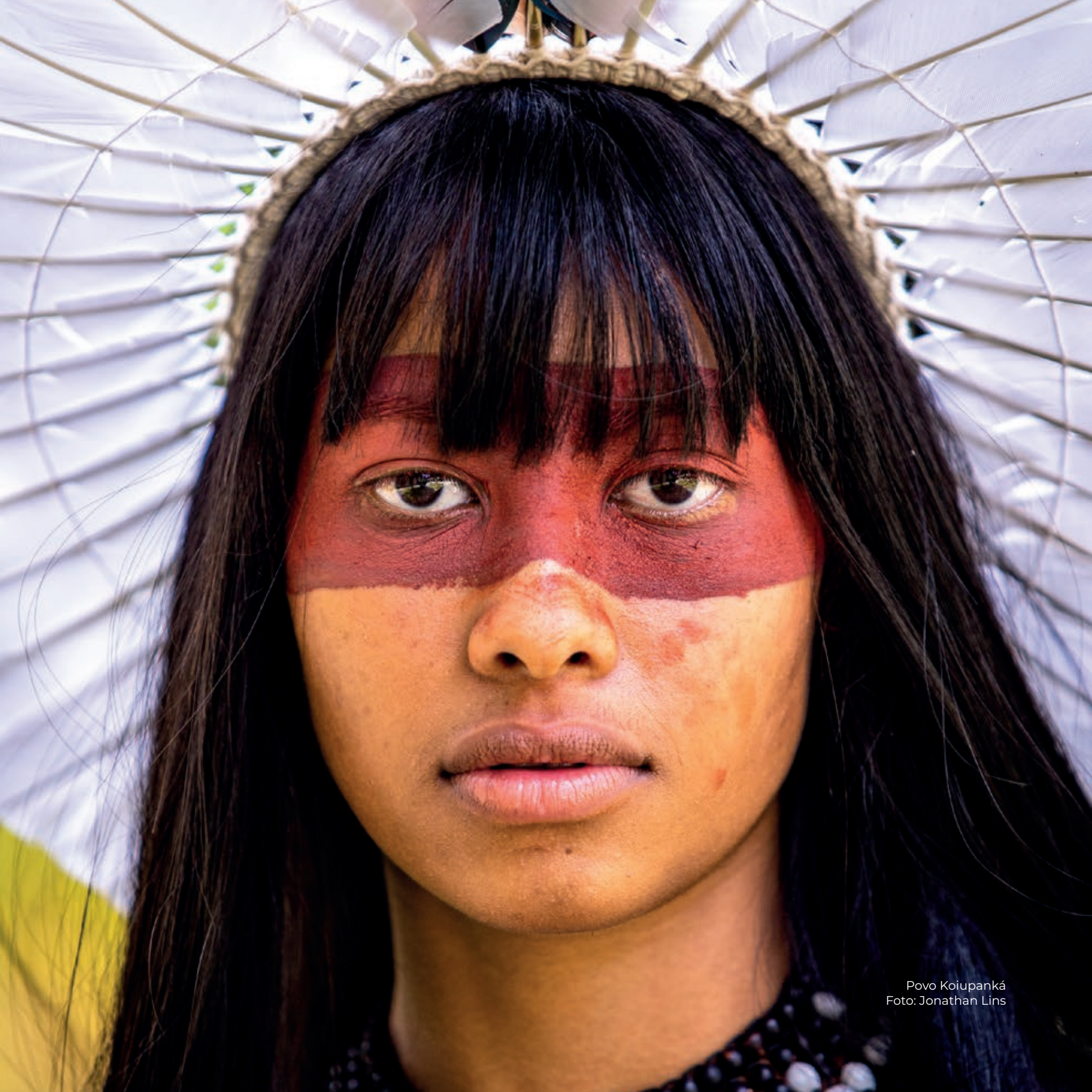
Povo Koiupanká