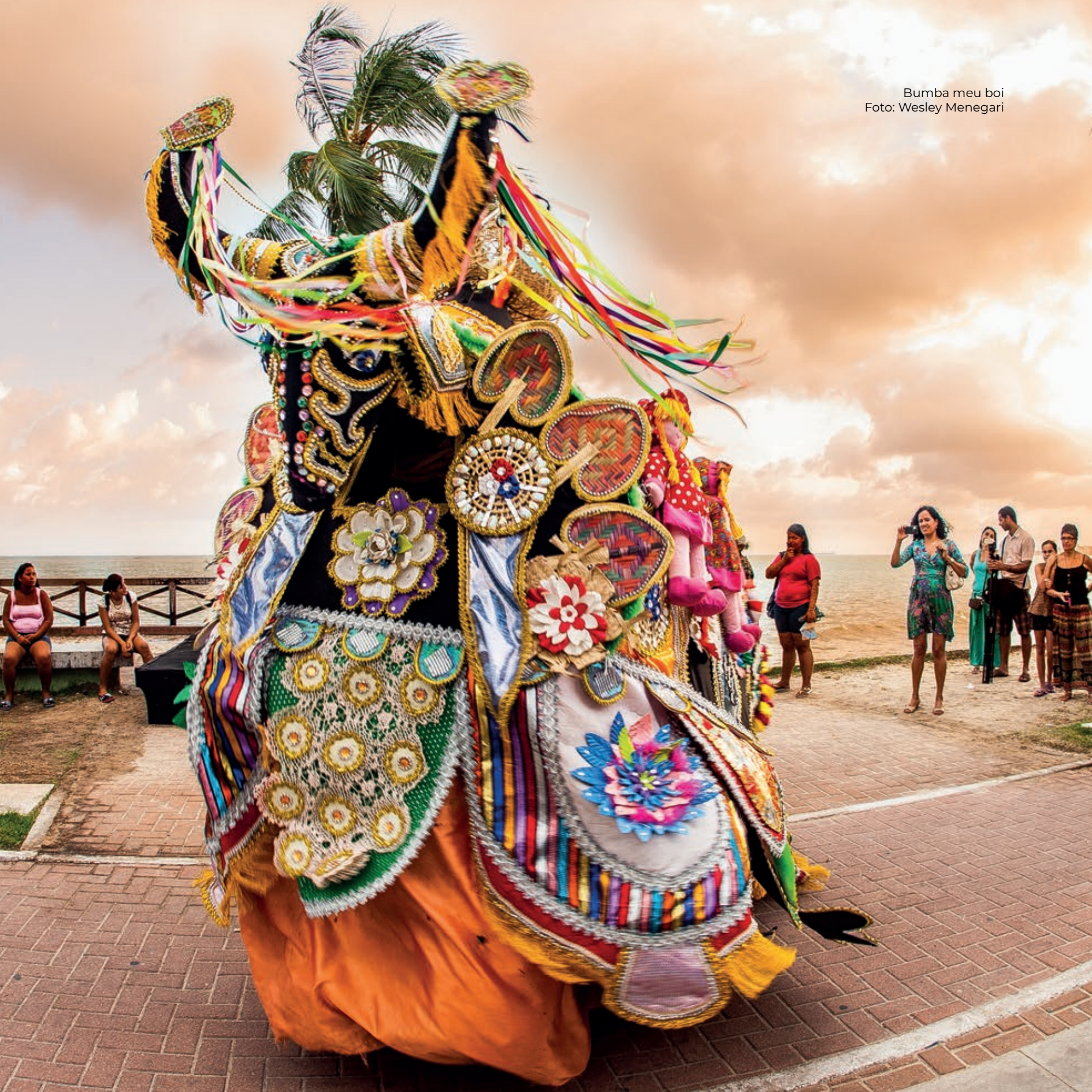
Bumba meu boi