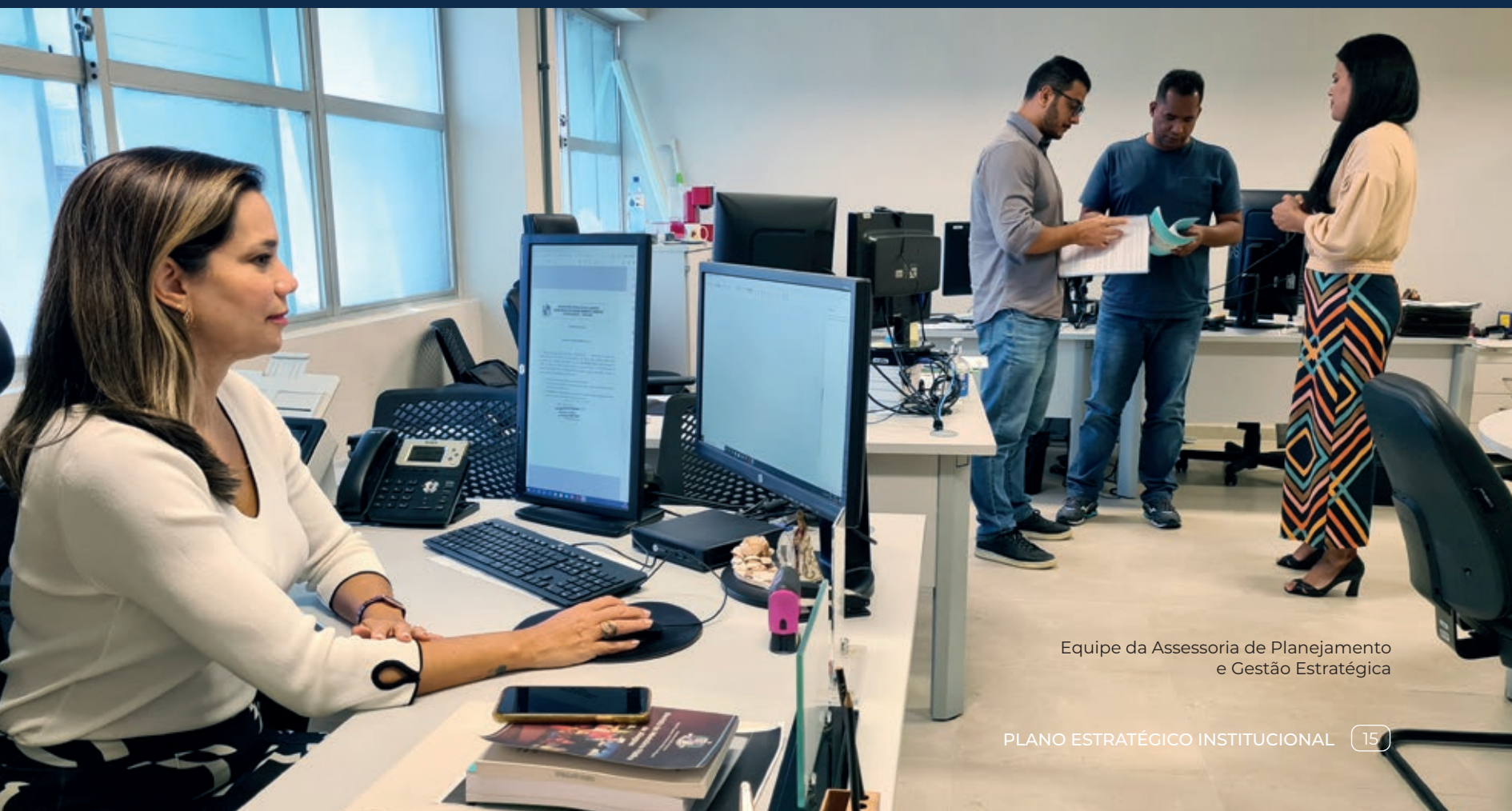
Equipe da Assessoria de Planejamento e Gestão Estratégica