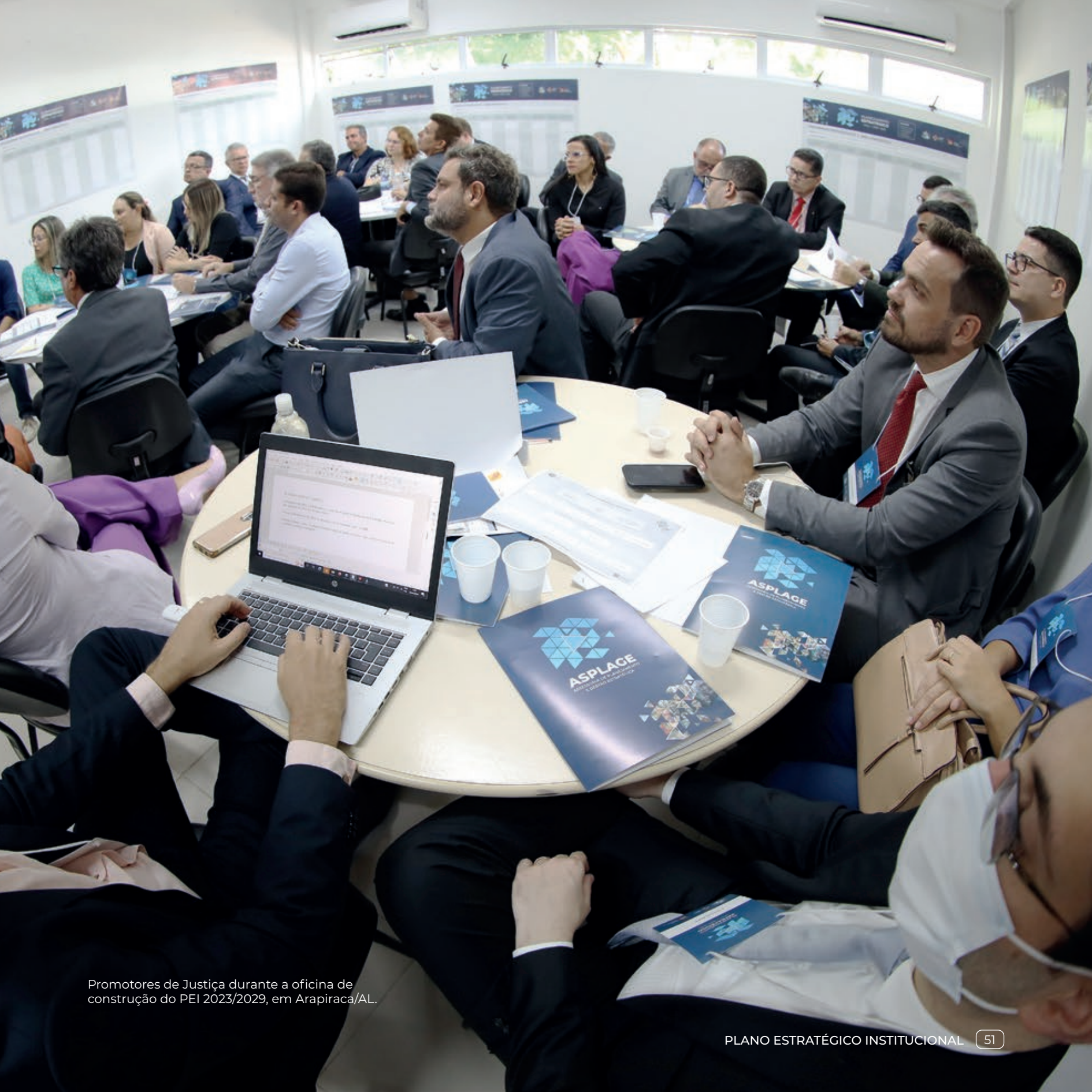
Promotores de Justiça durante a oficina de construção do PEI 2023/2029, em Arapiraca/AL.